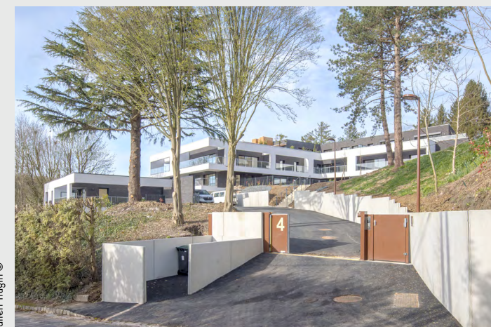
Julien Tragin ©

Prise de participation majoritaire dans Valcity. Dans la ligne des valeurs de Odyssee Immobilier, Valcity exerce son activité dans l'immobilier de logement et tertiaire dans les Hauts-De-France.