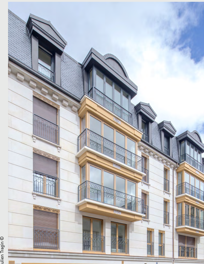
Julien Tragin ©