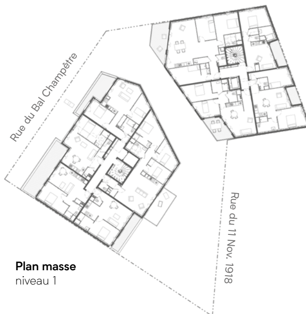
Plan masse niveau 1