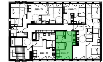
PLAN D'ETAGE ET LOCALISATION