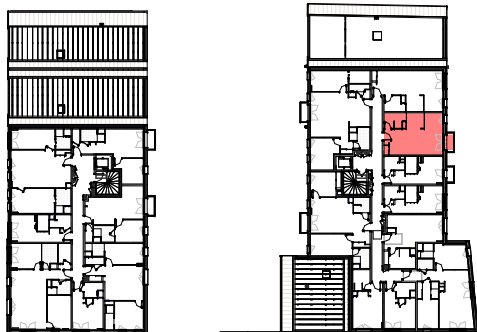
Plan de repérage appartement B-308