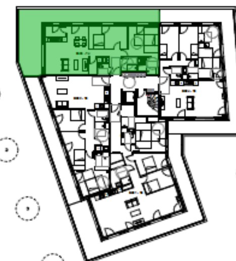
PLAN D'ETAGE ET LOCALISATION