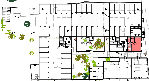
Plan de repérage appartement B-001