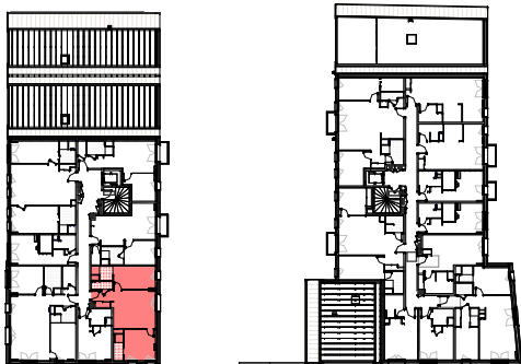
Plan de repérage appartement A-306