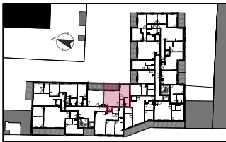
Plan de repérage / R+3 - Attique Appartement A302