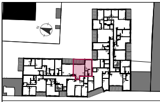
Plan de repérage / R+2 Appartement A202