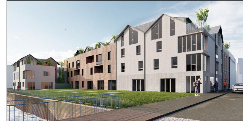
4 Rue Des Archers 80000 Amiens