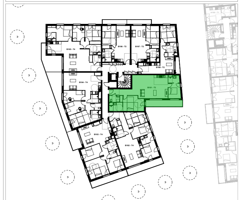
PLAN D'ETAGE ET LOCALISATION