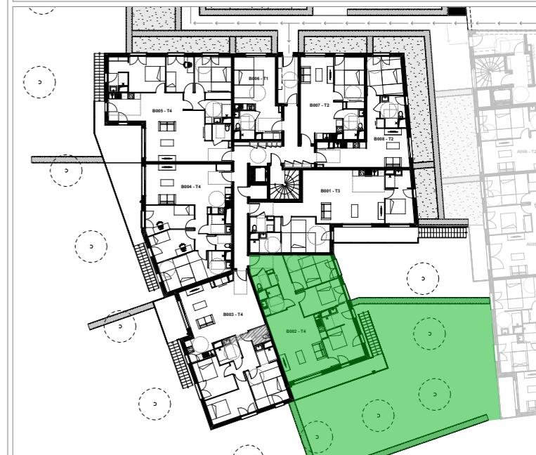
PLAN D'ETAGE ET LOCALISATION