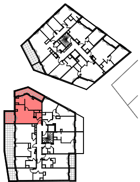
Plan de repérage appartement A_205